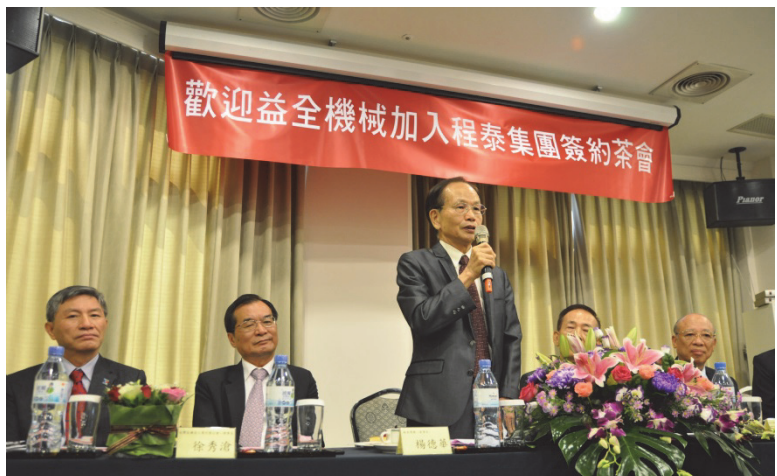
益全機械加入程泰集團簽約茶會