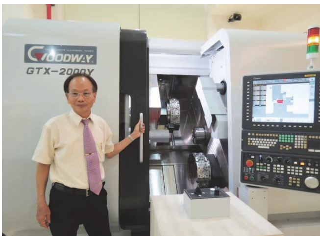
工商時報專訪留影