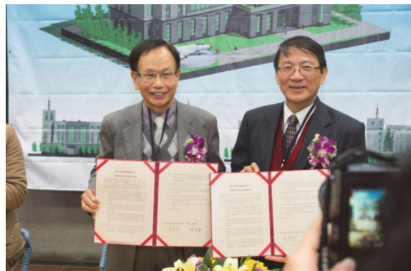
中興大學工具機技術研發大樓捐贈儀式