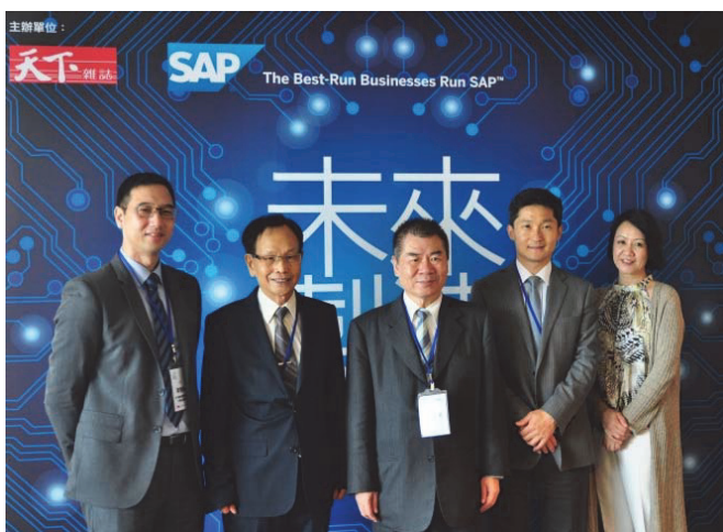
天下雜誌—工業 4.0 論壇主講人合影

去年，我買了十幾本「父母恩重難報經」給公司的幹部閱讀，幹部們都私下竊竊私語這跟公司治理有什麼關係。殊不知，在我認知的價值觀中，始終認為「孝道」應該擺在最重要的位置，所謂「百善孝為先」，任何的人生目標，都應該建立在「孝」這個字的基礎上。其次，學弟們想必都是擁有高度自主性與理想性的優秀青年，對於生涯的規劃自毋需我多言，我僅以時常惕勵自己的「專注、用心」四個字與學弟共勉，人生的道路沒有捷徑，惟有「專注理想、用心經營」如此而已。即使最終成果不如預期，也必將無愧於心。