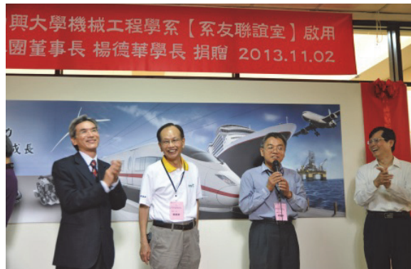
中興大學機械系系友室落成典禮