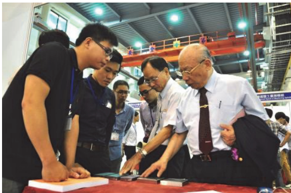
2014年中興大學暨程泰集團工具機技術與實作競賽獎

大學聯考放榜後，成績超乎我的預期，志願選填醫學院是沒有問題的。但因自小看到鮮血跟打針就有莫名的恐懼感，因此便在母親的建議下，選擇就近臺中、跟自己興趣相結合的科系為主，最終就以中興機械系為目標，想不到，自此便與工具機結下了不解之緣。