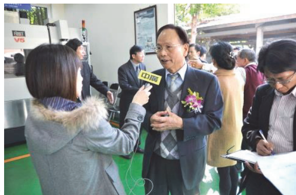
修平科大五軸加工中心機捐贈儀式