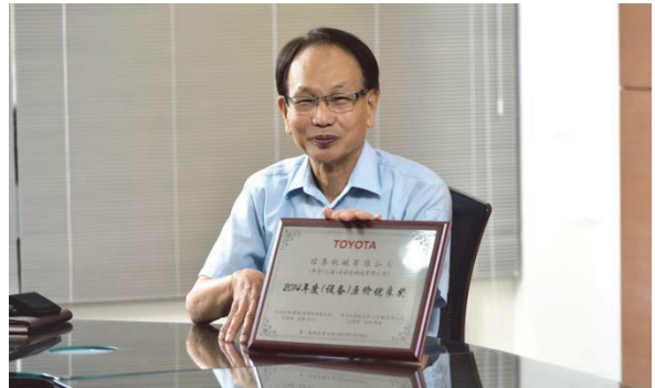
與日本 TOYOTA 設備原價優良獎（最佳性價比獎）開心合影