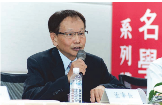
向第一名學習系列講座—董事長致詞