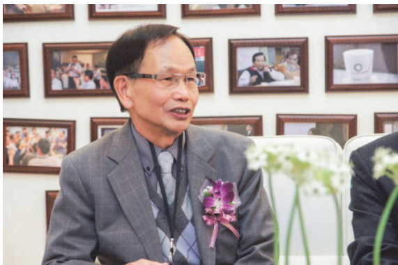
捐贈中興大學機械系系友室—受訪留影