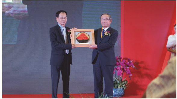
江蘇吳江廠落成典禮—FANUC 代表致贈賀禮儀式

益全機械亦加入了程泰集團，同業間開始傳言我以企業併購為經營重心，其實不然，知名者如 Google、Apple，長期以來便持續併購具未來性之企業，藉以完整化集團於市場競爭之版圖，這是一種戰略考量，非為單純加乘公司的營收，尤其臺灣工具機業者於國際市場多數屬於中小型企業，要與歐美日等大型集團比拚，一定要發揮我們產業供應鏈集中、營運策略靈活的優勢，藉由整合多元的力量，才是臺灣工具機產業未來的生存之道。