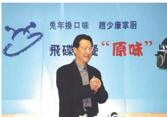
飛碟電台 飛碟晚餐

謝謝母校中一中給我的基礎訓練，我不論從事商業、政治或媒體事業，都能發揮所學，勝任愉快，在每個崗位上，我都竭盡所能，貢獻自己小小的心力，希望能對國家社會有所貢獻，也是我對母校的一點回饋。