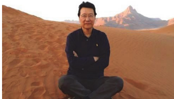
2014年 非洲 納米比亞