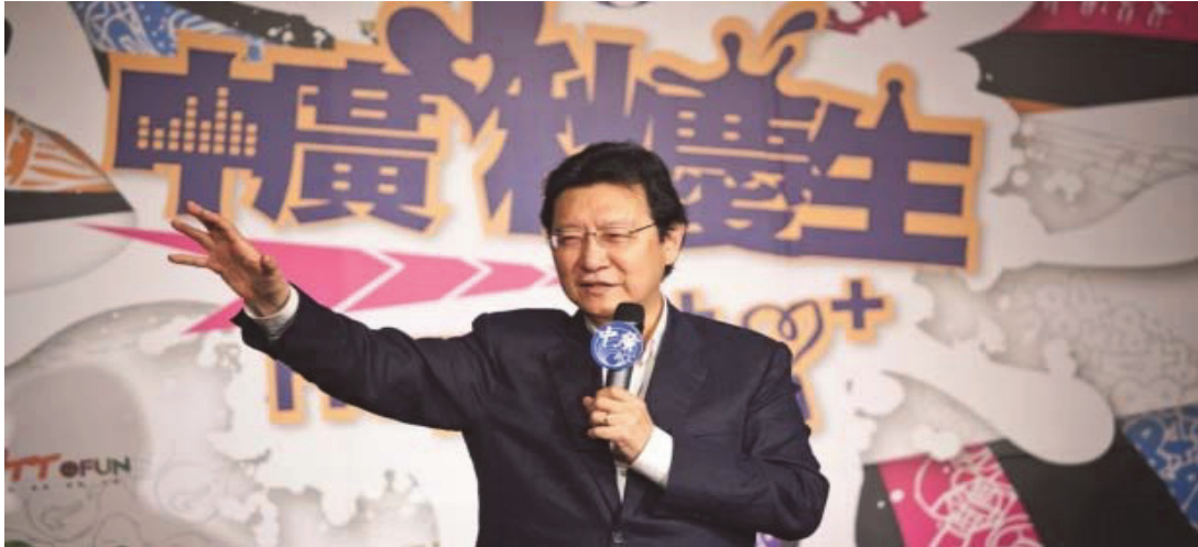
2012年8月中國廣播股份有限公司84歲台慶

我最喜歡的一句話是「盡人事，聽天命」，凡事「盡其在我」，盡心盡力，對得起自己就好，也許不一定會成功，但至少問心無愧，不虛此生，這也是我要和學弟妹共勉的話。