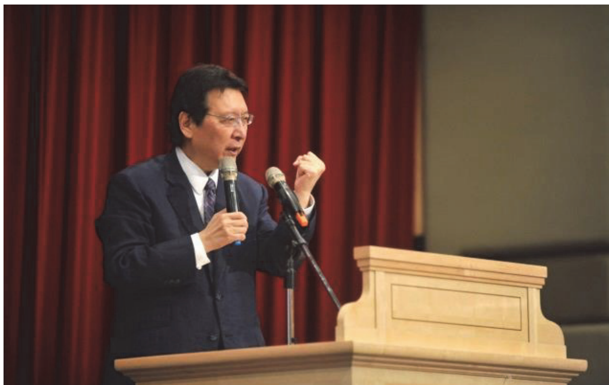
2011年應邀至台大管理學院之中歐國際工商學院 EMBA 文化論壇 演講