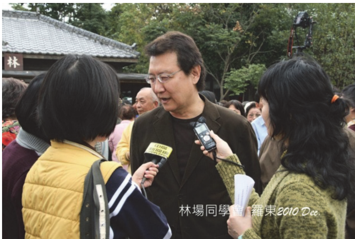
2010年宜蘭羅東森場同學會