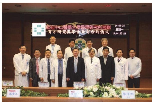
童綜合醫院與中山醫學大學簽約儀式

除了醫療以外，社會上還有許多弱勢族群需要經濟、社會、教育等各方面的資源關懷與協助，個人怎能獨善其身，所以義無反顧地擔任財團法人童傳盛文教基金會董事長，以非營利組織的力量投入協助政府推動各項的社會福利方案，在行醫之餘也能夠參與社會公益事業，善盡社會公民的責任。