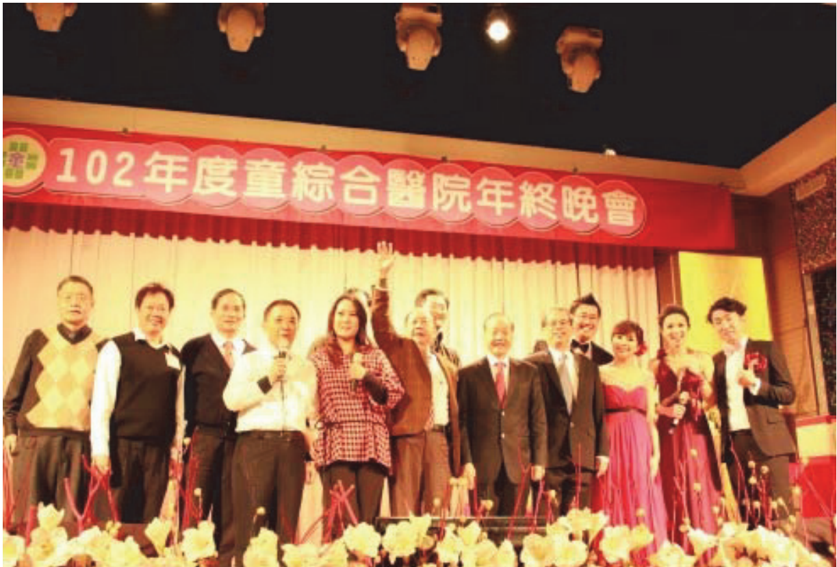
102年度童綜合醫院年終晚會

經由多年來的淬鍊，迄今還是很感念當年在臺中一中求學的生涯，奠定了往後能專心執志地在學術研究與本業上努力，也開擴了視野。自由風氣是中一中最優良的傳統，造就了學生能夠為自己興趣與前途自動自發努力學習的精神；尤其迎接大數據時代，資訊每秒都在改變，在商業、經濟及各種領域中，各項重大決策將是經由資料和分析而作出，而並非基於經驗和直覺。