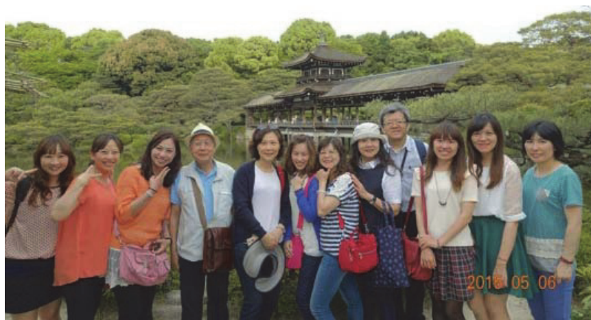
童綜合醫院員工旅遊-日本行