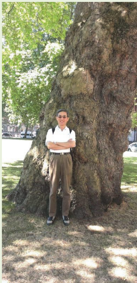
攝於英國倫敦西敏寺庭園