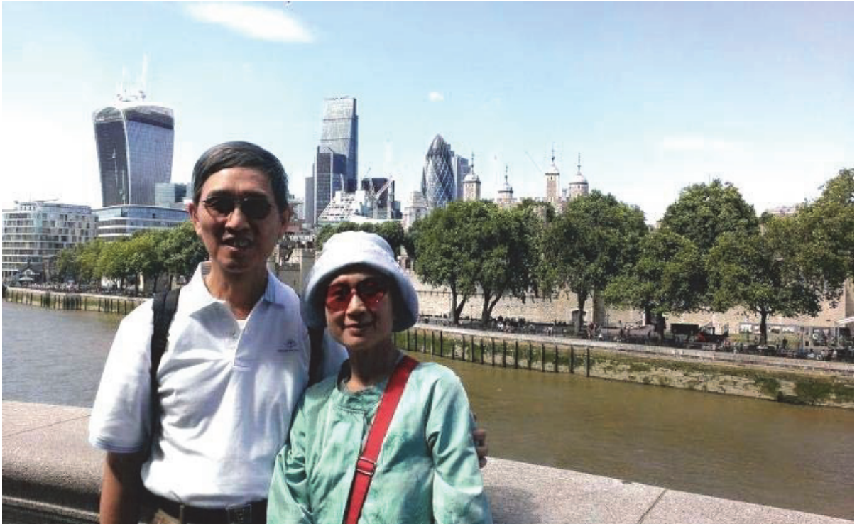
攝於英國倫敦倫敦塔前