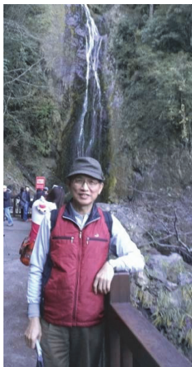
攝於臺中和平武陵農場 桃山瀑布

當時，臺灣高科技產業正要起步，而國內缺乏相關的人才，因此施顏祥獲邀參加國家能源發展的規劃諮詢工作，後更進一步獲邀進入經濟部科技顧問室(現經濟部技術處)服務，為發展臺灣科技產業進行扎根與技術移轉工作，同時也開啟他為臺灣經濟發展事務努力的