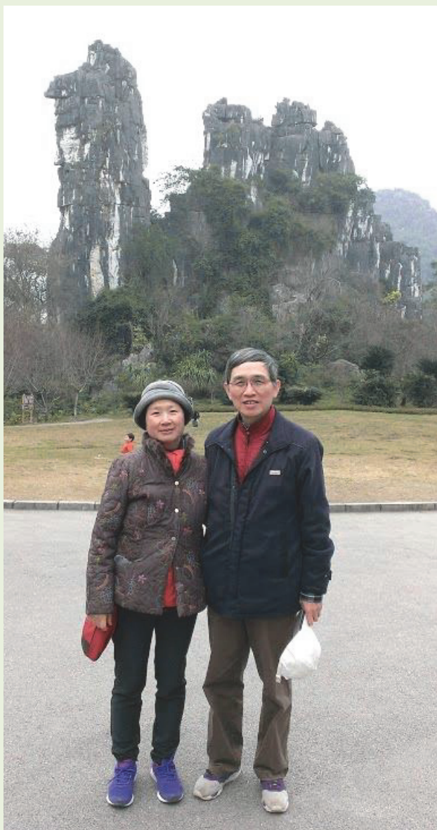
攝於廣西桂林駱駝山

弟妹們認真學習，勇於嘗試，勇於開創，更要勇於承擔。為自己、為家人、為社會做出積極貢獻。期待我們大家以『今日我以中一中為榮，明日中一中以我為傲』，互勉之。謝謝中一中的教誨，感恩。」