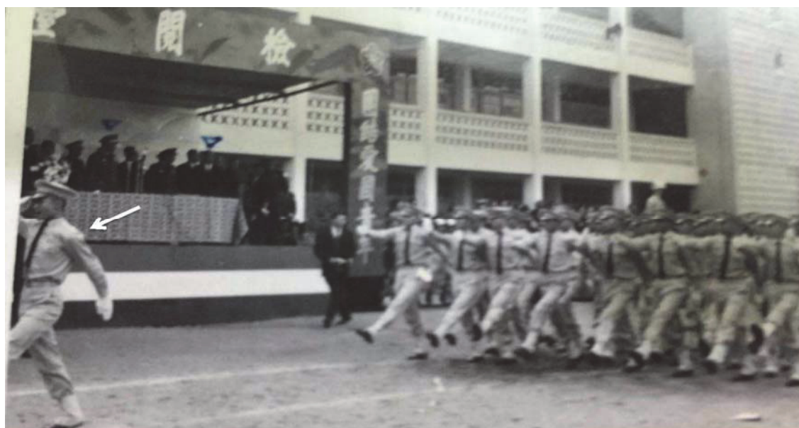
中一中 50 周年校慶，時任班長，帶領全班同學通過校閱台

（例如齊邦媛老師，雖然我進一中時她已離開）。初中畢業幸運地直升高中。高二時，適逢母校 50 週年校慶，當時擔任班長，所以留下帶領全班同學通過校閱台的鏡頭（見所附照片）。高中時的班導師是教我們數學的廖天才老師，他面冷心熱，非常關心學生，畢業後大家還都保持聯繫，現已退休多年了。民國五十六年自臺中一中畢業之後，進入成功大學土木工程學系就讀。