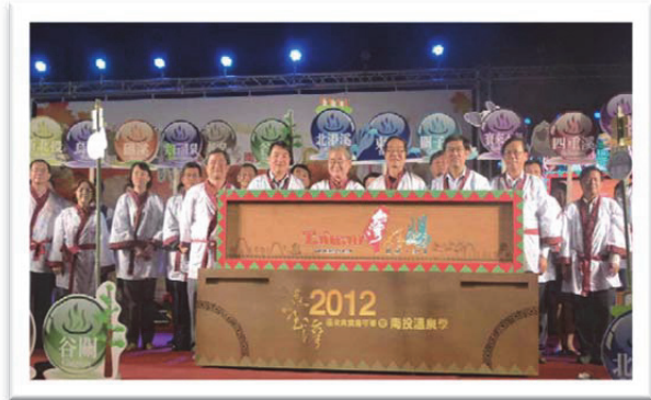
交通部長時期參加南投溫泉季，推動觀光

Motivation、Ability、Opportunity」，強調動機是可激勵的，能力是可培養的，機會是可創造的，想要累積人生成就，就應該展現動機、培養能力、整握機會，要做對的事，贏在對的決策上！