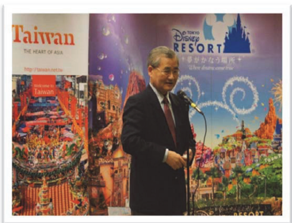
擔任交通部長時，臺灣燈會期間歡迎東京迪斯奈表演團